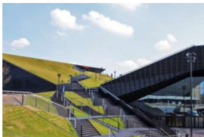
Międzynarodowe Centrum Kongresowe w Katowicach – miejsce Konferencji InterNanoPoland